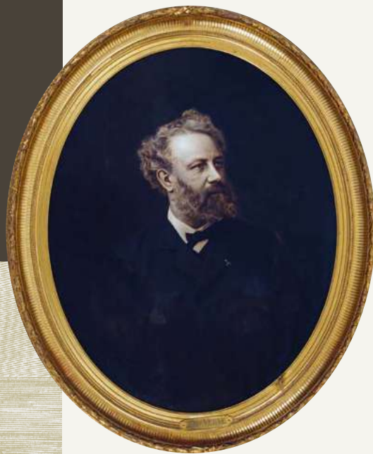
Retrato de Julio Verne, óleo sobre lienzo