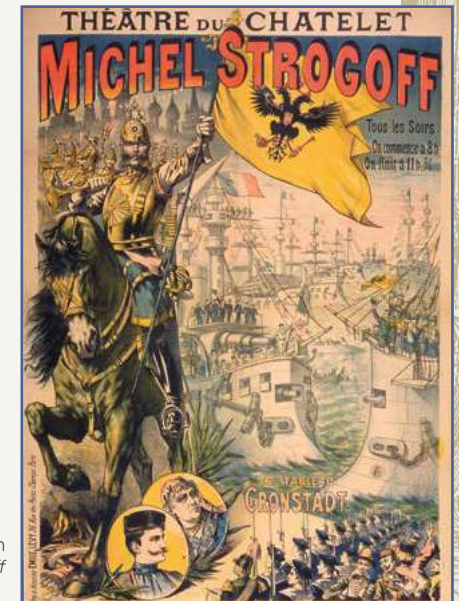
Cartel para la adaptación teatral de Miguel Strogoff

En total, Julio Verne escribió más de treinta obras de teatro. Sin embargo, esta parte de su creación literaria se mantuvo en secreto. De hecho, fue al representar sus novelas La vuelta al mundo en ochenta días , Miguel Strogoff y Los hijos del capitán Grant cuando alcanzó el éxito en el teatro. Obras épicas, con decorados y puestas en escena sensacionales, que anticipan las adaptaciones cinematográficas del siglo siguiente.