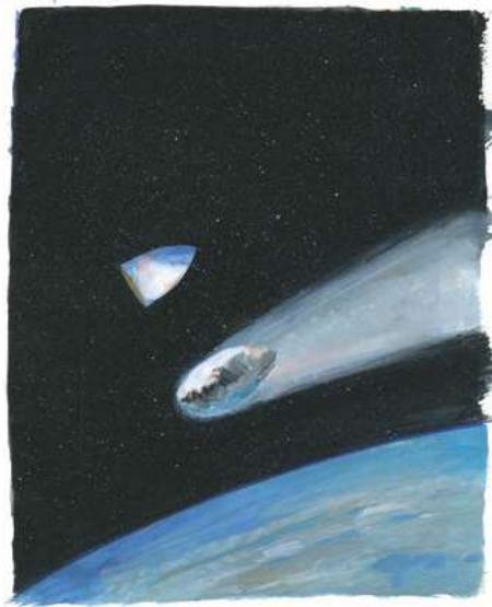
Jame's Prunier, Ilustración original para Alrededor de la Luna (ediciones Gallimard)