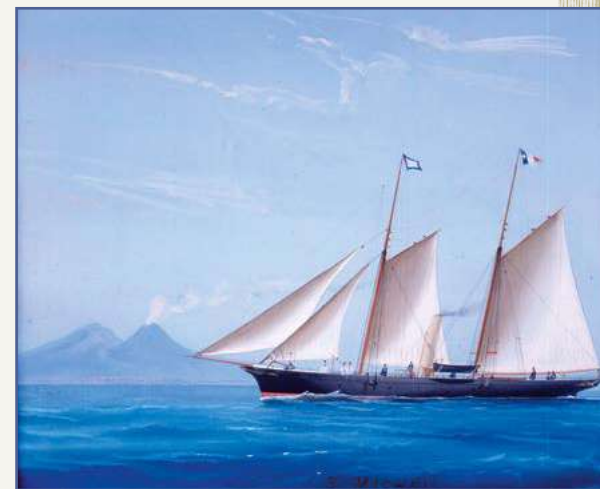
El Saint-Michel III en la bahía de Nápoles, gouache

Lo que más le inspiraba era el mar. A partir de 1866 concilió la escritura y la navegación. Las escapadas a bordo de sus propios barcos, los tres Saint-Michel , fueron un auténtico estímulo para la imaginación... Veinte mil leguas de viaje submarino se redactó parcialmente en el modesto camarote del Saint-Michel I .