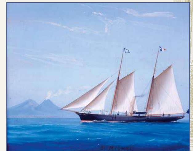
Le Saint-Michel III en baie de Naples, gouache

La mer l'inspire avant tout. Et à partir de 1866 il concilie écriture et navigation. Les échappées à bord de ses propres bateaux, les trois Saint-Michel , sont un véritable stimulant pour l'imagination... Vingt mille lieues sous les mers est ainsi en partie rédigé dans la modeste cabine du Saint-Michel I .