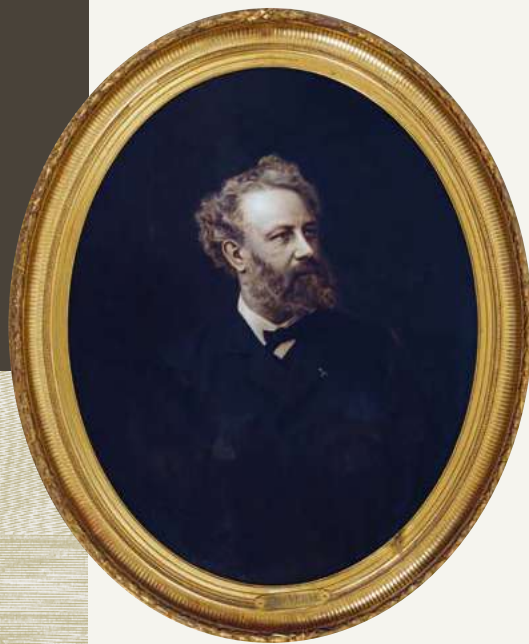
Portrait de Jules Verne, huile sur toile